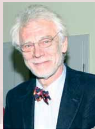
> Prof. Dr. Jürgen Zöllner, Senator für Bildung, Wissenschaft und Forschung in Berlin